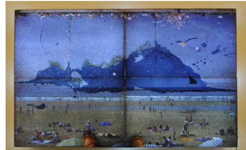
Paysage de plage

Que voit –on sur ce tableau?, demande la médiatrice. Tout le monde se croit au Mont Saint Michel, mais... pas tout à fait ...Normal ! C’est tout simplement la photographie d’une tache sur un trottoir, avec mégots et pieds du photographe penché vers le sol. « Alors, vous avez acheté cela ? », s’écrie l’un de nous. Eh oui ! La médiatrice, pour nous convaincre, appuie sur un interrupteur : le tableau s’illumine, tel une crèche de Noël et du groupe s’échappe un grand « AH !... ». Médusés et ravis ! Une plage fréquentée par les baigneurs de l’été est soudain apparue. Le tableau s’appelle « Les bergers d’Arcachon ». A la photo du trottoir s’est superposée une photo de la plage d’Arcachon et l’oeuvre ainsi créée, en référence au tableau de Nicolas Poussin, « Les bergers d’Arcadie », met en scène ce qui pourrait être un de nos paradis contemporains. Des détails peints (technique de la réserve) sur le mont qui se dresse au large (pyramides, obélisque, grue, temple) attestent de l’origine vendéenne des artistes: Clisson ! Deux photos sur un calque et une boîte lumineuse ont créé la magie ... Faut aller voir Clisson !