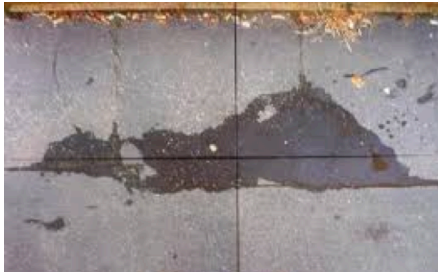
Tache sur le trottoir

❖ Les bergers d’Arcachon de Lorient et Mélia (2010) Derrière le trottoir, la plage !